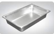
밥팬 • 규격 : 530×325×100mm • 조달식별번호 : 22415536