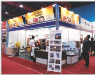
〈2013 프랜차이즈 박람회〉