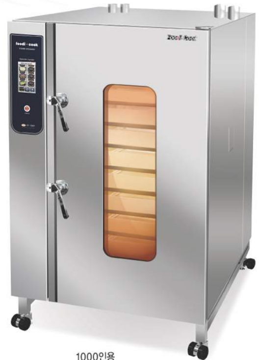
1000인용 26팬수납 (13단2열)