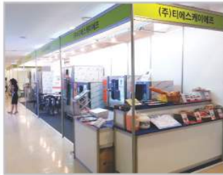
〈2014 영양사 학술대회〉