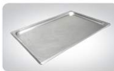
밥팬뚜껑 • 규격 : 530×325mm • 조달식별번호 : 22415537